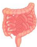
CANDIDA OVERGROWTH IN THE INTESTINES